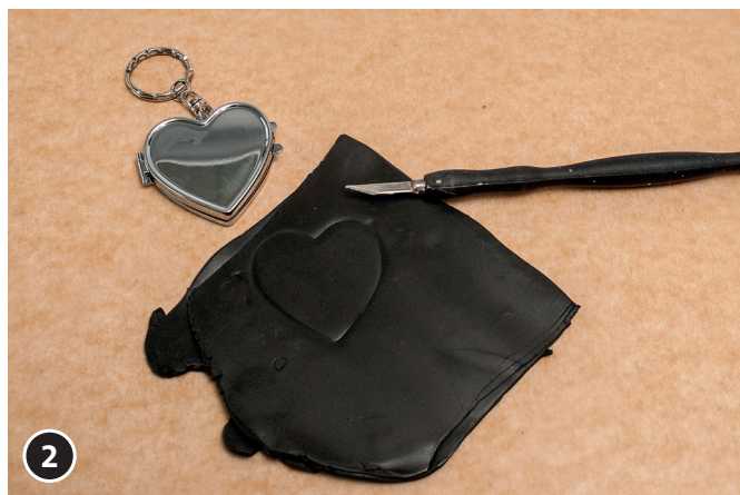
2 Poser le porte-clé en forme de coeur sur la plaque de pâte à modeler. Exercer une légère pression.