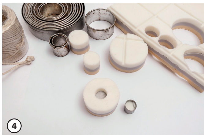
4 Mittig in die runde Seife, mit dem kleinsten Ausstecher, eine durchlässige Bohrung stechen.