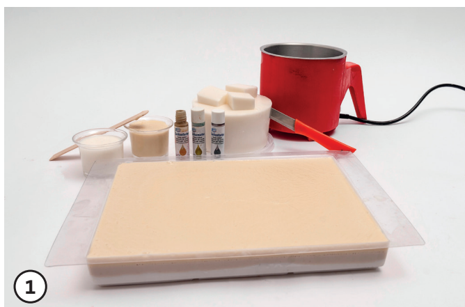
1 Gießform mit unterschiedlich-farbigen Seifenschichten füllen. (Arbeiten nach der Grundanleitung.)