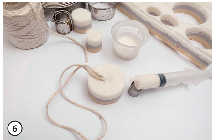
6 Bohrung mit flüssiger Seife füllen und erkalten lassen.