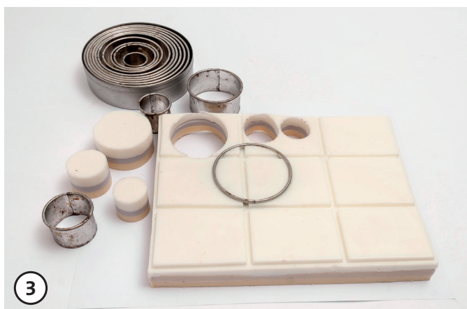
3 Mit der runden Ausstechform Seifen aus der Seifenplatte trennen.