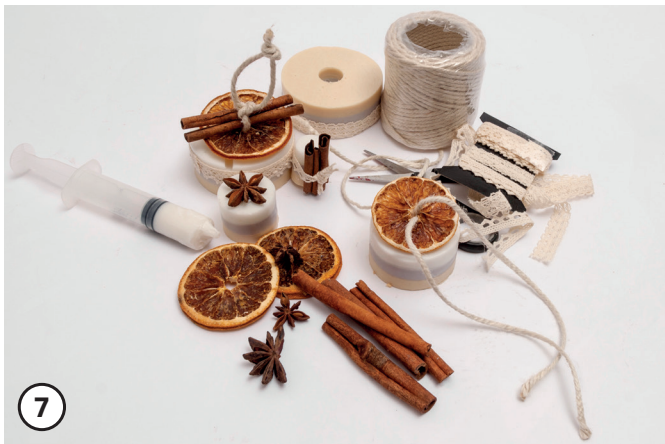
7 In die Orangenscheibe mittig ein Loch bohren. Scheibe auf beide Garnenden fädeln. Wenn gewünscht Zimtstange anknoten. Zuletzt zur Fixierung nochmals einen Knoten legen. Sternanis kann mit etwas flüssiger Seife, auf dem Seifenstück, fixiert werden. Gewünschte Deko-Spitze am Seifenstück abmessen und abtrennen. Spitze ebenso mit etwas flüssiger Seife befestigen.

Viel Spaß bei der Umsetzung wünscht Ihnen Ihr OPITEC-Kreativteam!