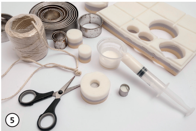
5 Ein Stück Jutegarn abtrennen. Garnmitte in die Bohrung der Seife einlegen, sodass die Garnenden nach außen liegen.