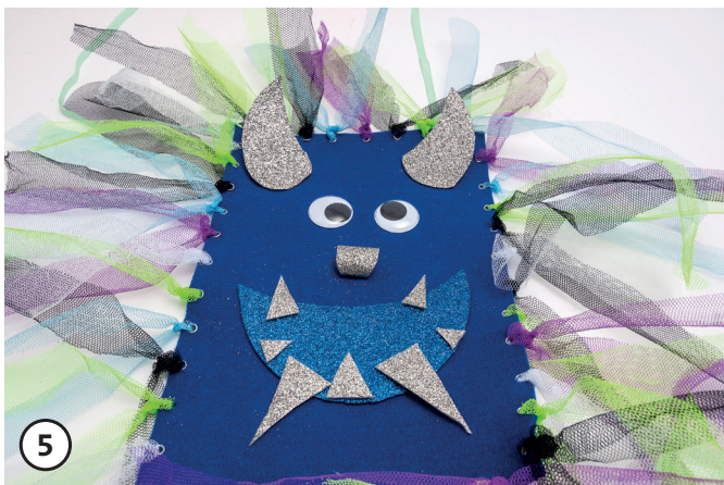
5 Aus dem Glitterfilz das Gesicht gestalten und die Wackelaugen ankleben.