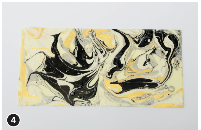
4 Die Wachsplatte vorsichtig auf die marmorierte Wasseroberfläche auflegen und leicht andrücken. Vorsichtig herausnehmen, trocknen lassen und fertig.

Viel Spaß bei der Umsetzung wünscht Ihnen Ihr OPITEC-Kreativteam!