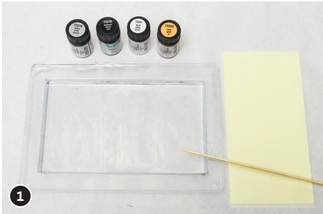
1 Schale Fingerdick mit Wasser auffüllen.