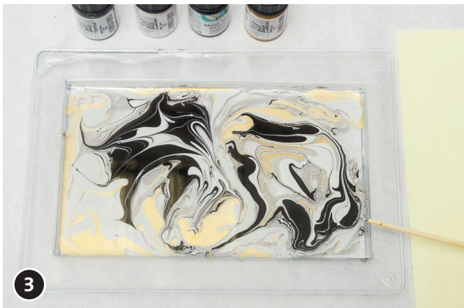
3 Mit dem Bambusspieß die Farben ineinander verziehen.