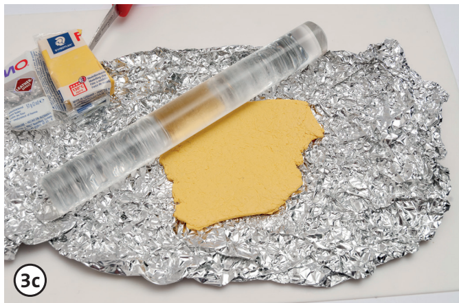
Incidi le strutture con pellicola di alluminio