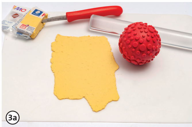
Incidi le strutture con timbri o rulli

Diversi metodi per incidere le strutture sul Fimo: