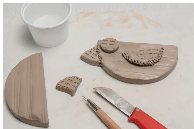
4 Pour rajouter des morceaux en terre de modelage, étaler de nouveau une plaque de terre de modelage et découper les formes à l'emporte-pièce. Disposer les morceaux en terre de modelage et exercer une légère pression pour les fixer.