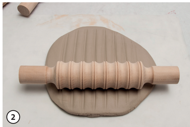
2 Estamper des motifs sur la terre de modelage à l'aide des tampons ou du rouleau pour pâte à modeler.